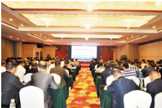
顺天建设召开2019年度项目质量标准化考评及强化关键岗位人员质量安全履职培训会。

目标管理，提升项目关键岗位人员的履职能力和专业技能，全面提高项目管理团队水平，建设公司于2019年10月23日进行了项目质量标准化考评及强化关键岗位人员质量安全履职培训，并委派项目关键岗位人员、项目现场总负责人、项目技术负责人及公司工程部全体人员共145人参加了此次培训。