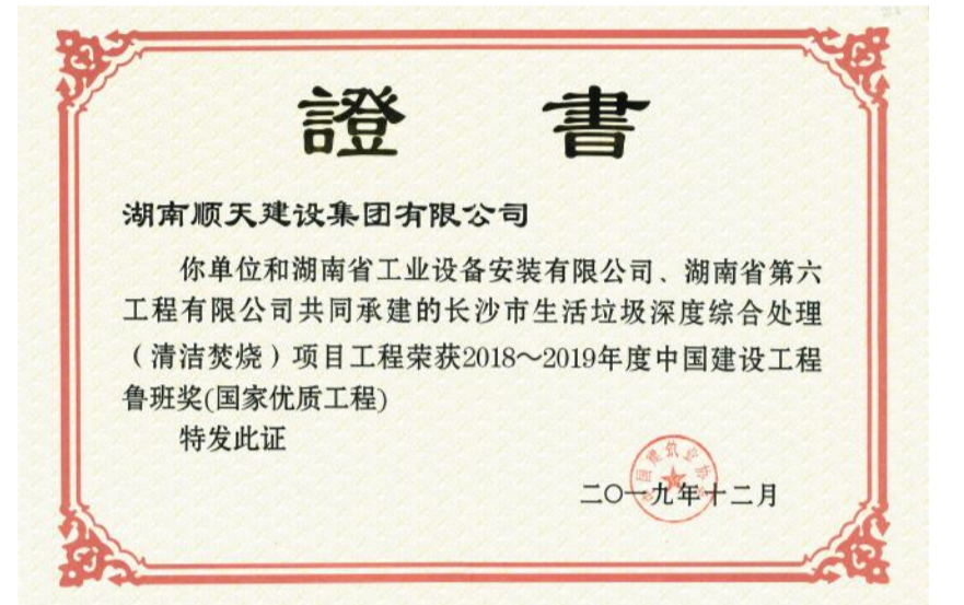
湖南顺天建设集团有限公司承建长沙市生活垃圾深度综合处理(清洁焚烧)项目获奖证书。