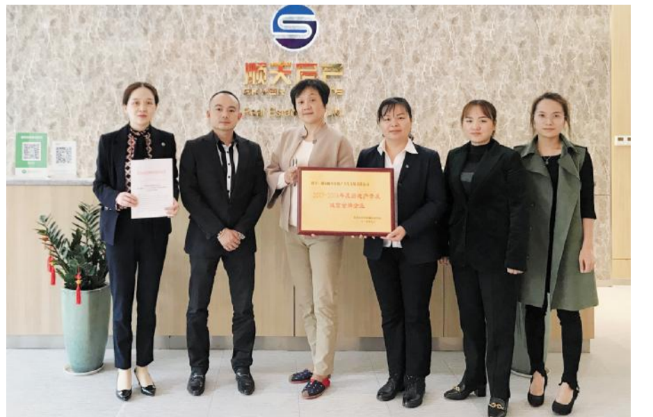
11月12日，长沙市房地产开发协会秘书长等一行领导开展上门送金牌活动。

在当前长沙市房地产形势趋紧、下行压力加大的背景下，对房地产企业的诚信要求更加紧迫。市场形势瞬息万变，机遇与挑战同在，谁把握了机会，谁就赢得了先机。诚信经营是打造企业品