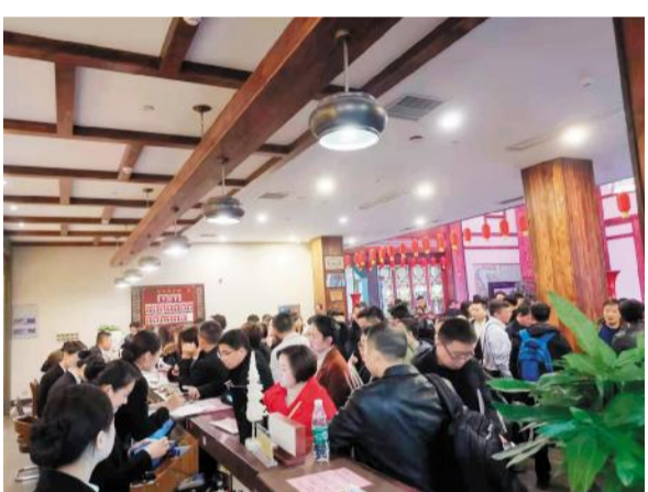
洋沙湖客棧前台接待参会人员落座。