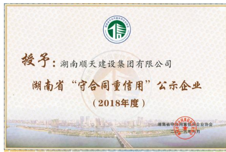
顺天建设荣获省“守合同重信用”企业荣誉称号。

【本报讯】近日，湖南省守合同重信用企业协会对2018年度湖南省“守合同重信用”企业进行公示，顺天建设顺利通过湖南省守合同重信用企业协会的评审，多年来，我司凭借良好的社会信誉和健全的合同管理体系，连年荣膺省“守合同重信用”企业荣誉称号。