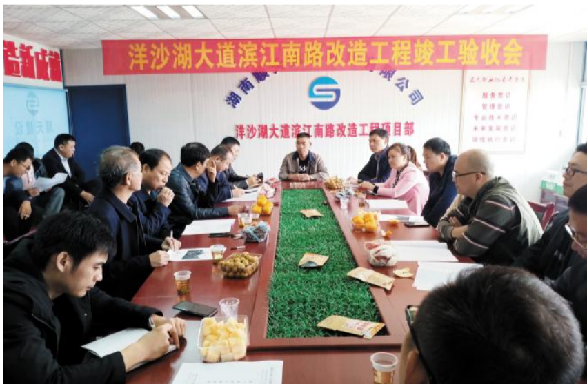
湘阴县洋沙湖大道、滨江南路提质改造工程PPP项目竣工验收会。

【本报讯】经过三年的艰苦奋战，顺天人发扬着不怕苦不怕累的精神，最终保质保量地圆满完成了湘阴县又一重要民生工程——湘阴县洋沙湖大道、滨江南路提质改造工程。并于2019年11月5日正式竣工验收，顺利交付湘阴县政府。