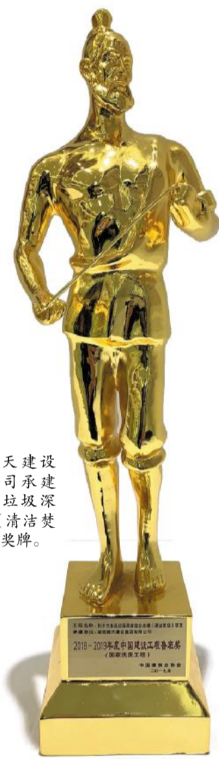
湖南顺天建设集团有限公司承建长沙市生活垃圾深度综合处理(清洁焚烧)项目获奖奖牌。