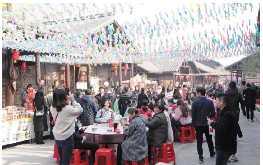
第三届洋沙湖湖湘民俗文化旅游节现场。