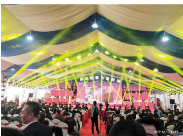
中国石化湖南石油分公司第七届易捷年货节启动仪式在洋沙湖会议中心举行。