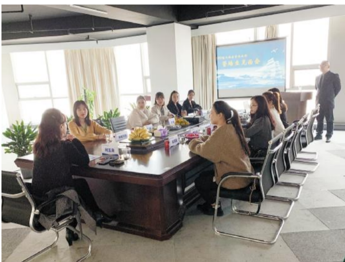
2019年酒管公司管培生见面会现场柯总分享宝贵从业经验。